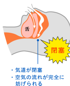
睡眠時無呼吸症候群 (閉塞型)